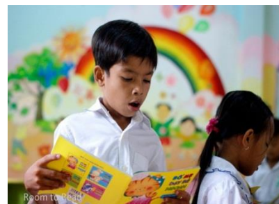
図書室で本を読む子どもたち(ベトナム)