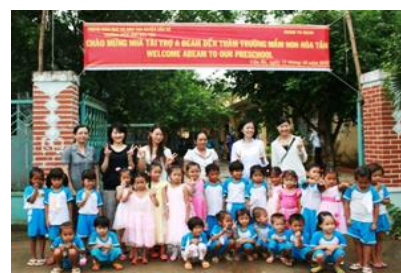
Hoa Tan Preschool (ベトナム)

※2013年10月に訪問 のぼりに“Welcome ABeam”と書かれています