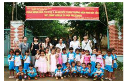
Hoa Tan Preschool (ベトナム)

※2013年10月に訪問 のぼりに“Welcome ABeam”と書かれています