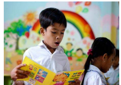
図書室で本を読む子どもたち(ベトナム)