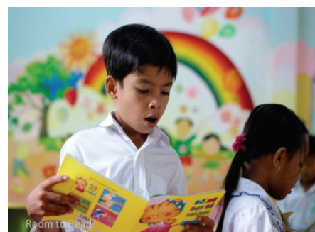
図書室で本を読む子どもたち(ベトナム)