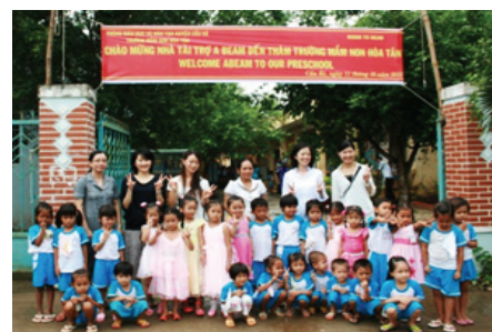
Hoa Tan Preschool (ベトナム)

※2013年10月に訪問 のぼりに“Welcome ABeam”と書かれています